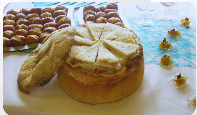
9. Pains surprises