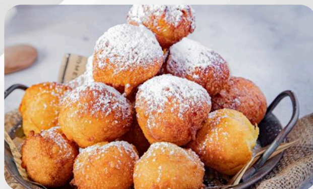
15. Mini beignet