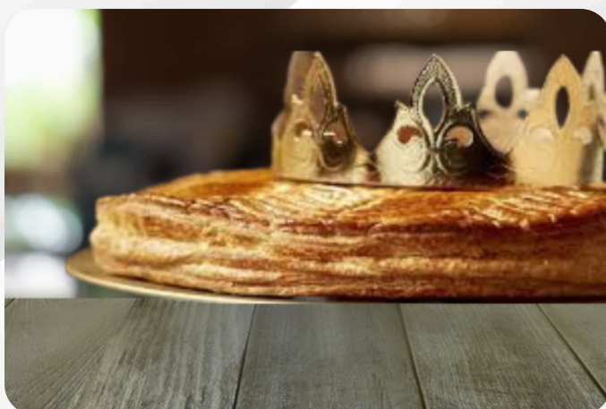
21. Galettes des rois