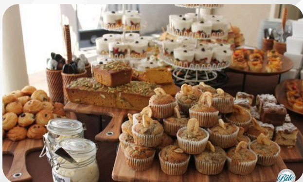
14. Mini muffins salés / sucrés