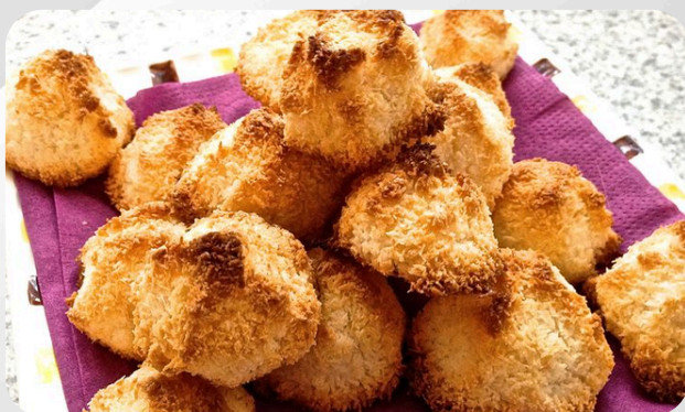
19. Rocher coco