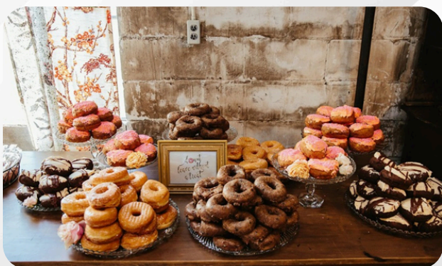
18. Mini donuts