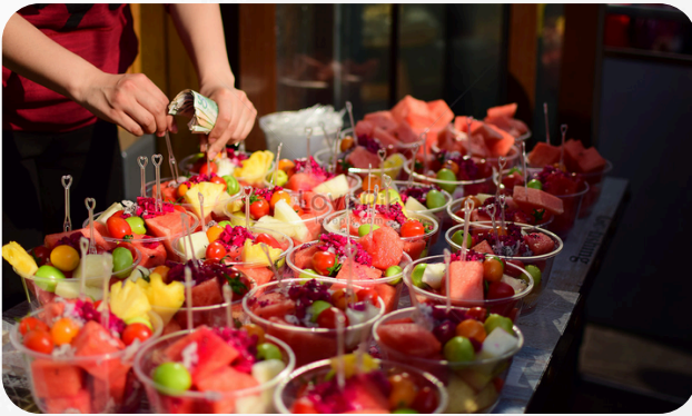
8. Salades de fruits