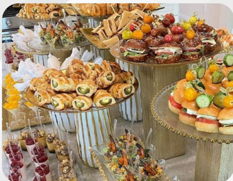
11. Plateaux de petits fours salés / sucrés